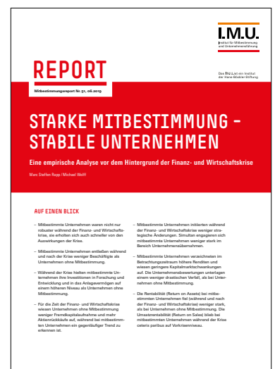
Starke Mitbestimmung – Stabile Unternehmen. Eine Empirische Analyse vor dem Hintergrund der Finanz- und Wirtschaftskrise. Reihe: Mitbestimmungsreport, Nr. 51. Düsseldorf: 2019, ISSN: 2364-0413