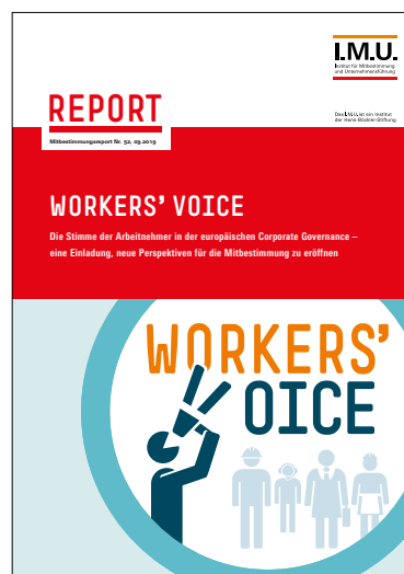
Die Stimme der Arbeitnehmer in der europäischen Corporate Governance – eine Einladung, neue Perspektiven für die Mitbestimmung zu eröffnen. Reihe: Mitbestimmungsreport, Nr. 52. Düsseldorf: 2019, ISSN: 2364-0413